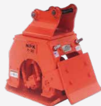
Dozer blad Alle modellen