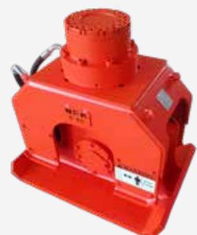
Hydraulische rotatie C-2D ~ C-8C